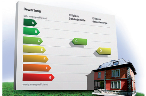
Abb.: GEAK-Bewertung Gebäudeeffizienz ( www.geak.ch )

Der GEAK ist der „Gebäudeenergieausweis der Kantone“. Er zeigt, wie viel Energie ein Gebäude bei Standardnutzung verbraucht. Dieser Energiebedarf wird in Klassen von A (sehr energieeffizient) bis G (wenig energieeffizient) beurteilt.